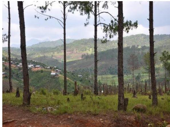
Suy thoái rừng ở Việt Nam.

Do rất dễ bị tổn thương trước các tác động của biến đổi khí hậu gây nên, chính phủ Việt Nam xem vấn đề biến đổi khí hậu là một trong những thách thức lớn cho phát triển và coi đây là lĩnh vực ưu tiên cần được hỗ trợ phát triển. Chương trình Mục tiêu Quốc gia về biến đổi khí hậu của Việt Nam tập trung nhiều vào các hoạt động thích ứng. Kế hoạch này xếp các vấn đề về nước, nông nghiệp, biển và vùng ven biển vào danh sách các vấn đề ưu tiên và nhạy cảm nhất, đồng thời cũng nhấn mạnh nhu cầu xây dựng hoạt động ứng phó biến đổi khí hậu ở vùng đồng bằng sông Hồng và sông Cửu Long. Chiến lược Quốc gia về Thích ứng với Biến đổi khí hậu được thông qua năm 2011 đã đưa ra các mục tiêu nhằm đảm bảo có đủ lương thực và nước, đồng thời thực hiện giảm nghèo và tình trạng bất bình đẳng giới và bảo vệ các nguồn tài nguyên thiên nhiên; nâng cao nhận thức, trách nhiệm và năng lực của các bên liên