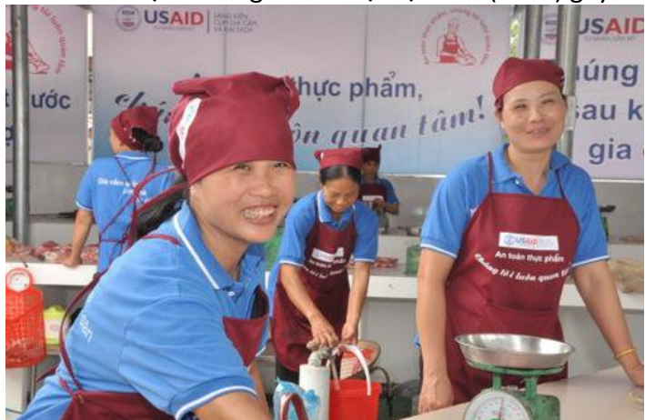
USAID hỗ trợ nâng cấp chợ gia cầm Hòa Mạc tại tỉnh Hà Nam.

Việt Nam là một trong bốn quốc gia trên toàn cầu có dịch cúm gia cầm độc lực cao (HPAI) gây ra các đợt bùng phát dịch thường xuyên ở gia cầm (tính đến nay đã có hơn 3.000 ổ dịch và hơn 40 triệu gia cầm bị tiêu hủy) và những trường hợp bệnh nghiêm trọng ở người (123 trường hợp, trong đó 61 người đã tử vong). Virus cúm gia cầm độc lực cao tiếp tục phát triển và đặt ra mối đe dọa với sức khỏe cộng đồng, sức khỏe động vật và nền kinh tế. Cúm gia cầm độc lực cao vẫn là dịch địa phương và còn nhiều thách thức, đáng chú ý nhất là hệ thống canh tác và cung cấp thực phẩm tạo điều kiện cho sự xuất hiện của virus ở động vật gây chết người hoặc mầm bệnh dễ dàng truyền nhiễm giữa người với người. Điều quan trọng khi giải quyết những thách thức này sẽ là tiếp tục tăng cường năng lực của Bộ Nông nghiệp và Phát triển Nông thôn và Bộ Y tế nhằm xây dựng hệ thống xử lý phù hợp những thách