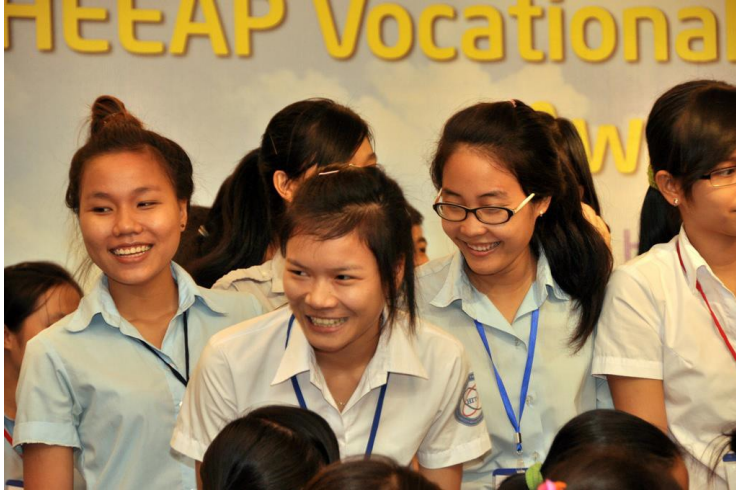
Sinh viên nữ ngành kỹ thuật ở thành phố Hồ Chí Minh nhận học bổng của Chương trình liên kết giáo dục đại học ngành kỹ thuật do USAID và các đối tác doanh nghiệp hỗ trợ.

Các Doanh nghiệp vừa, nhỏ và rất nhỏ (MSME) của Việt Nam, chiếm gần 85% trong số 471.000 doanh nghiệp có đăng ký tại Việt Nam, đã có những đóng góp đáng kể vào thành công của đất nước về giảm nghèo và phát triển kinh tế, tạo ra phần lớn việc làm mới trong thập kỷ vừa qua. Tuy nhiên, vẫn còn một mảng tiềm năng lớn về đổi mới chưa được khai phá trong các Doanh nghiệp vừa, nhỏ và rất nhỏ, các trường đại học, và doanh nghiệp xã hội nhằm mang lại lợi ích lớn hơn cho người nghèo và những người chưa được tiếp cận dịch vụ, nhằm