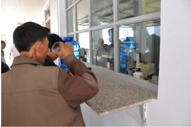
USAID hỗ trợ điều trị duy trì bằng methadone tại Điện Biên.

1. Cung cấp dịch vụ dự phòng, chăm sóc và điều trị HIV/AIDS hiệu quả và chất lượng thông qua tăng cường năng lực của nước sở tại. Các hoạt động dự phòng HIV/AIDS sẽ tập trung đẩy mạnh tiếp cận dịch vụ tư vấn và xét nghiệm cho các nhóm nguy cơ cao thông qua hoạt động tiếp cận cộng đồng, truyền thông thay đổi hành vi, thúc đẩy các mặt hàng thuốc và vật phẩm y tế dự phòng và mở rộng điều trị duy trì bằng methadone. Các hoạt động chăm sóc và điều trị HIV/AIDS sẽ nâng cao chất lượng sống cho người sống chung với HIV/AIDS và gia đình họ thông