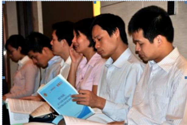
USAID hỗ trợ một hội thảo tham vấn với các đại diện đơn vị kinh doanh về Luật Hải quan sửa đổi của Việt Nam.