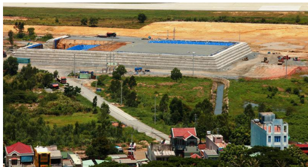
Kết cấu mô xử lý khử hấp thu nhiệt ô nhiễm dioxin tại sân bay Đà Nẵng.

Bom mìn vật nổ sau chiến tranh, nguồn gốc chủ yếu của Hoa Kỳ, tiếp tục gây ảnh hưởng tới một dải diện tích lớn trên lãnh thổ Việt Nam. Chính phủ Việt Nam đã đầu tư vào nhiều chương trình không chỉ nhằm xác định vị trí, di dời và phá hủy Bom mìn vật nổ sau chiến tranh – vật liệu chưa nổ (UXO), mìn và các vật liệu nổ khác – mà còn xử lý các tác động của vật liệu chưa nổ đối với sức khỏe và hoạt động sinh kế của người dân Việt Nam sống ở những vùng bị ảnh hưởng. Việt Nam đã xây dựng chiến lược quốc gia nhằm giải quyết các vấn đề phức tạp và đầy thách thức liên quan đến Bom mìn vật nổ sau chiến tranh với sự hỗ trợ của Chính phủ Hoa Kỳ.