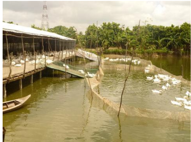
Một trang trại nuôi vịt ở tỉnh Cần Thơ, đồng bằng sông Cửu Long.

Biến đổi khí hậu chỉ là một trong số vài lĩnh vực chính tác động đến dân cư Việt Nam. Hiện quốc gia này đang đối mặt với gánh nặng bệnh kép, sự hoành hành và tỷ lệ tử vong ngày càng tăng do các bệnh không truyền nhiễm, tai nạn và thương vong, cùng với mối đe dọa tiếp tục từ các bệnh truyền nhiễm, đòi hỏi những nguồn lực đáng kể từ chính phủ. Tỷ lệ nhiễm HIV/AIDS vẫn là vấn đề nghiêm trọng của y tế công cộng trong các nhóm dân cư mục tiêu, cùng với đó là tỷ lệ sốt xuất huyết ở đồng bằng sông Cửu Long, sốt rét ở các tỉnh miền núi phía Bắc và Tây Nguyên, tỷ lệ nhiễm lao ở miền Nam, bao gồm lao kháng đa thuốc (MDR-TB). Các mối đe dọa từ các bệnh dịch mới nổi, như dịch cúm gia cầm hiện tại, hoặc các ổ dịch H1N1 mới bùng phát, đặt ra những thách thức lớn hơn đối với hệ thống y tế cho người và động vật.