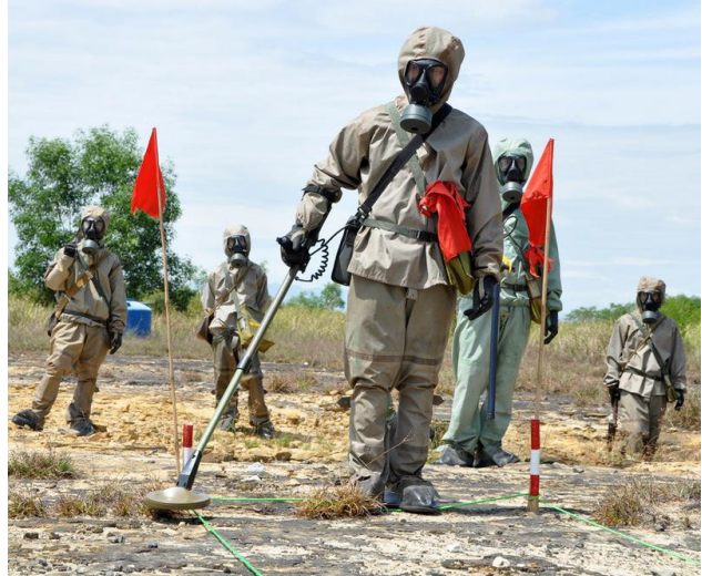
Một người lính Việt Nam thực hiện công tác phát hiện và xử lý Vật liệu chưa nổ tại Đà Nẵng.

Việt Nam đã thiết lập khung chiến lược cấp quốc gia nhằm giải quyết các vấn đề phức tạp và thách thức liên quan đến Bom mìn vật nổ sau chiến tranh với sự hỗ trợ từ Chính phủ Hoa Kỳ. Hoa Kỳ tiếp tục trợ giúp triển khai các hoạt động trực tiếp nhằm loại bỏ Vật liệu chưa nổ, hướng dẫn về rủi ro từ Vật liệu chưa nổ cho các nhóm dân cư dễ bị tổn thương, và hỗ trợ cho những người bị ảnh hưởng ở những vùng bị ô nhiễm nặng nề nhất dọc theo các khu vực phi quân sự trước đây. Hoạt động hỗ trợ trực tiếp này giải quyết những nhu cầu trước mắt đồng thời thực hiện mẫu một cách tiếp cận toàn diện đã được chứng minh cho công tác xử lý Bom mìn vật nổ sau chiến tranh cho Chính phủ Việt Nam. Chúng tôi cũng hỗ trợ nâng cao năng lực cho các cơ quan có thẩm quyền của Việt Nam để lập kế hoạch, quản lý và thực hiện các hoạt động do Việt Nam tự tài trợ nhằm giải quyết ô nhiễm Bom mìn vật nổ sau chiến tranh.