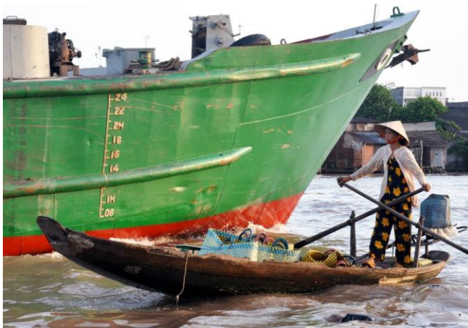
Các trung tâm đông dân cư và các vùng nông nghiệp chủ chốt đặc biệt dễ bị ảnh hưởng bởi tình trạng mực nước biển dâng và nguy cơ bão ngày càng tăng ở các vùng đồng bằng thấp và đường bờ biển dài. Ảnh: USAID Việt Nam.

Trong thập kỷ vừa qua, Việt Nam đã có những bước tiến đáng kể nhưng chưa đồng đều về các mặt kinh tế và xã hội. Các thành quả trong lĩnh vực y tế và giáo dục bao gồm nâng cao phổ cập giáo dục tiểu học và cải thiện khả năng tiếp cận của các nguồn lực y tế công. Tuy nhiên, năng lực quốc gia đầy đủ 20 (nhân lực, khu vực công, tư, tổ chức phi chính phủ) là một trong những yếu tố quan trọng còn thiếu trong những nỗ lực hiện tại của Việt Nam nhằm đạt được các Mục tiêu Phát triển Thiên niên kỷ (MDG). 21 Những nỗ lực phát triển ở nhiều quốc gia sẽ thất bại, dù họ được hỗ trợ nguồn ngân sách lớn, nếu vấn đề phát triển năng lực bền vững không được chú ý nhiều hơn và thận trọng hơn. Nguyên tắc này được biết đến và công nhận rộng rãi bởi nhiều tổ chức tài trợ cũng như các quốc gia đối tác, và được đề rõ trong “Tuyên bố Paris về Hiệu quả Viện trợ” năm 2005.