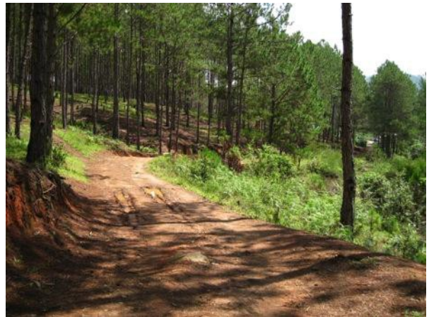
Rừng nhiệt đới ở Việt Nam.

Tính đến năm 2005, khoảng 37% (12 triệu hecta) diện tích đất trên cả nước được phân loại là đất rừng, gồm khoảng 10 triệu hecta rừng tự nhiên và 2 triệu hecta rừng trồng. Trong 50 năm vừa qua, thảm thực vật rừng tự nhiên đã suy giảm đáng kể cả về số lượng và chất lượng. Nhận thức rõ xu hướng suy thoái này đã khiến chính phủ đưa ra những nỗ lực bảo vệ rừng vào giữa những năm 90 và đã làm tăng độ che phủ rừng trong những năm vừa qua. Tuy nhiên, phần lớn khu vực rừng được trồng gần đây là trong rừng độc canh; diện tích rừng nguyên sinh còn nguyên vẹn đến nay là rất nhỏ, bị cô lập trên các khu vực núi cao. Việt Nam có một hệ thống các khu bảo tồn – gọi là rừng “đặc dụng” – gồm 126 khu với tổng diện tích khoảng 2 triệu hecta. Việt Nam có 5 khu Ramsar, 2 Di sản Thiên nhiên Thế giới do UNESCO công nhận, 8 Khu dự trữ Sinh quyển do UNESCO cấp bằng chứng nhận, và 4 vườn quốc gia được công nhận là Di sản ASEAN. Với những nỗ lực này, Việt Nam đã đưa từng loại hình hệ sinh thái rừng chính vào chương trình bảo vệ. Bất chấp những nỗ lực đáng khen ngợi của Việt Nam, tình trạng mất rừng vẫn tiếp diễn ở mức độ chưa được phản ánh trong các số liệu thống kê chính thức và hoạt động khai thác gỗ trái phép tiếp tục làm biến mất nhiều vạt rừng lớn.