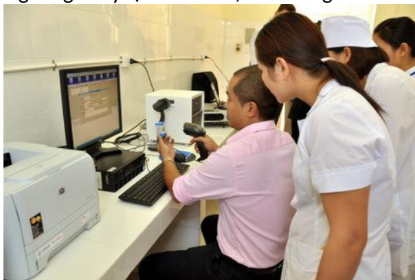
USAID hỗ trợ cung cấp thiết bị phát hiện lao nhanh và tập huấn sử dụng ở Điện Biên.

Lao và sốt rét cũng là mối đe dọa chính đối với sức khỏe cộng đồng. Việt Nam đứng thứ 12 trên thế giới về bệnh lao với khoảng 180.000 ca nhiễm lao mới mỗi năm và 29.000 ca tử vong vì lao hàng năm; khoảng 80 ca tử vong mỗi ngày. Chiến lược này sẽ tìm hướng giải quyết những điểm yếu của ngành lao bao gồm thiếu hụt ngân sách và năng lực của nguồn nhân lực trong việc phát hiện và điều trị lao ở tất cả các cấp, đặc biệt ở cấp huyện, xã và trong các trại giam. Tỷ lệ phát hiện ca nhiễm vẫn thấp do việc sử dụng biện pháp phát hiện bị động. Nhiều bệnh nhân tìm đến dịch vụ tư và hoạt động chuyển gửi từ các phòng khám, nhà thuốc tư đến cơ sở công lập còn yếu. Tình trạng kháng thuốc lao hàng đầu ngày càng tăng và tỷ lệ nhiễm lao, lao kháng đa thuốc và đồng nhiễm lao/HIV trong các cơ sở khép kín cũng tăng lên. Năng lực dự phòng và điều trị sốt rét ở những vùng xuyên biên giới thuộc vùng núi phía Bắc và Tây Nguyên cũng sẽ là yếu tố cần thiết của KQTH này.