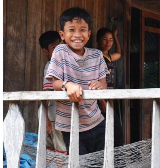
Một học sinh ở tỉnh Đak Lak, Tây Nguyên.

về phát triển để hàm ý sự tham gia vào cả hoạt động kinh tế và chính trị. Tài liệu của ADB, Khung Chỉ số Tăng trưởng Toàn diện 2012 , định nghĩa tăng trưởng có sự tham gia của mọi thành phần là tăng trưởng kinh tế với cơ hội công bằng và nhấn mạnh rằng hệ thống thể chế và quản trị nhà nước hiệu quả sẽ hỗ trợ cho các chính sách về tăng trưởng toàn diện (Chú ý: Xem biểu đồ phía dưới. Mặc dù USAID không dự tính lồng ghép tất cả các khía cạnh của mô hình vào Chiến lược, mô hình cũng là nền tảng tốt cho các mối liên kết giữa sự tham gia của mọi thành phần, tăng trưởng và quản trị nhà nước hiệu quả). Một điểm quan trọng là mô hình này liên kết quản trị nhà nước hiệu quả và năng lực con người là những yếu tố cần thiết cho tăng trưởng toàn diện. Ví dụ, ngân hàng ADB cho thấy quản trị nhà nước hiệu quả (đánh giá qua Chỉ số Năng lực Cạnh tranh cấp tỉnh hoặc các chỉ số khác) có tương quan với sự bất bình đẳng về thu nhập và trình độ học vấn. Ngoài ra, quan hệ đối tác phát triển toàn diện là yếu tố chủ chốt của Văn kiện Quan hệ đối tác Busan và trong việc nội địa hóa các nguyên tắc đó thông qua Văn kiện Quan hệ đối tác Việt Nam (VPD). Có thể xem mô tả về phát triển toàn diện trong Văn kiện VPD là hoàn thiện nhất, xác định rõ khái niệm này về mặt mở rộng quan hệ đối tác với xã hội dân sự, mở rộng quan hệ đối tác với khu vực tư nhân, đảm bảo bình đẳng giới và nâng cao vị thế của phụ nữ.