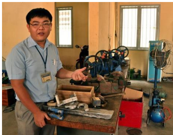
Phòng thực hành cơ khí tại Đại học Công nghệ Tp. Hồ Chí Minh

Trong giai đoạn phát triển của nền kinh tế công nghiệp Việt Nam, cần xây dựng chương trình đào tạo chất lượng cao, linh hoạt, phân tầng và có định hướng công nghiệp cho thế hệ trẻ về các kỹ năng tổng thể và các lĩnh vực chuyên ngành liên quan đến nhu cầu hiện tại của ngành công nghiệp, bao gồm cả những cơ hội tự phát triển kinh doanh.