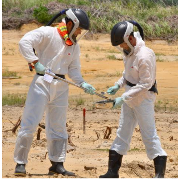
Lấy mẫu đất trong địa bàn Dự án Xử lý Môi trường Ô nhiễm Dioxin tại sân bay Đà Nẵng.

Tác động của dioxin, một chất trong Chất Da cam-một trong những loại chất diệt cỏ, tóe sức khỏe và môi trường là một trong những vấn đề nhạy cảm và bất đồng hơn trong các mối quan hệ giữa Việt Nam – Hoa Kỳ. Chính phủ Hoa Kỳ và Chính phủ Việt Nam đã thống nhất về một số căn cứ quân sự của Hoa Kỳ trước đây tại Việt Nam có lưu trữ và vận chuyển Chất Da cam, gồm Đà Nẵng và Biên Hòa, có mức độ tồn dư dioxin cao trong bùn đất vượt quá mức tối thiểu cho phép theo khuyến nghị của Cục Bảo vệ Môi trường Hoa Kỳ và Tổ chức Y tế Thế giới.