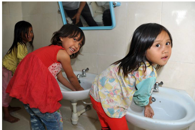
USAID hỗ trợ phát triển cho trẻ em và các trường mẫu giáo ở khu vực Tây Nguyên.

cũng sẽ tham gia vào quan hệ đối tác với khu vực tư nhân để mở rộng các cơ hội kinh tế, dựa trên thị trường cho nhóm dân cư dễ bị tổn thương, bao gồm nhóm dân tộc thiểu số, người nghèo, đặc biệt là phụ nữ và thanh thiếu niên nghèo, cũng như người khuyết tật hoặc người nhiễm HIV. Sự hợp tác này có thể bao gồm phát triển kỹ năng làm việc, tiếp cận tài chính, hỗ trợ kỹ thuật Doanh nghiệp nhỏ và rất nhỏ và các sáng kiến khác dựa trên chuỗi giá trị của khu vực tư nhân. Về các hoạt động với nhóm dân tộc thiểu số, cách tiếp cận và sự tập trung của chúng