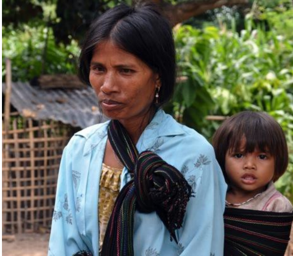
Tỷ lệ nghèo tại các vùng nông thôn Việt Nam cao hơn đáng kể so với khu vực thành thị.

Tình trạng nghèo: Việc áp dụng chính sách “mở cửa”, cải cách dựa trên định hướng thị trường, và hội nhập thị trường quốc tế đã thúc đẩy tăng trưởng kinh tế cao và tạo nhiều cơ hội làm kinh tế cho người nghèo ở Việt Nam. Tỷ lệ nghèo trung bình, được tính bằng chuẩn nghèo theo “nhu cầu cơ bản”, đã giảm từ 58% năm 1993 xuống còn 14,5% năm 2008. Ước tính đã có 28 triệu người thoát nghèo. Người nghèo được xác định theo các đặc điểm: hoạt động sinh kế phụ thuộc nhiều vào nông nghiệp, trình độ học vấn thấp và kỹ năng nghề còn yếu, bị tác động bởi thiên tai, sở hữu đất diện tích nhỏ hoặc không có đất, tách biệt về mặt vật chất và xã hội, và hạn chế trong tiếp cận thị trường và hoạt động tín dụng.