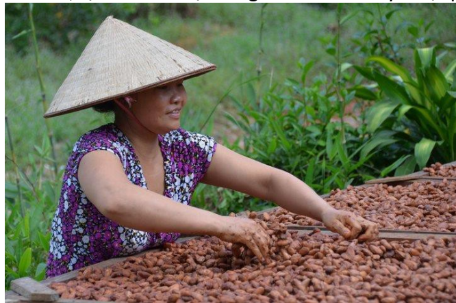
Nông dân và gia đình họ ở vùng nông thôn miền Trung Việt Nam thu lợi từ hoạt động trồng cây cao với sự hướng dẫn và hỗ trợ do USAID tài trợ.

địa phương. Hơn nữa, ngân sách và năng lực của chính quyền vẫn là một vấn đề và các chương trình về người khuyết tật hiện có ở Việt Nam, dành cho người gặp khó khăn về vận động, nghe và nhìn, lại chưa có nội dung về vấn đề khuyết tật phát triển.