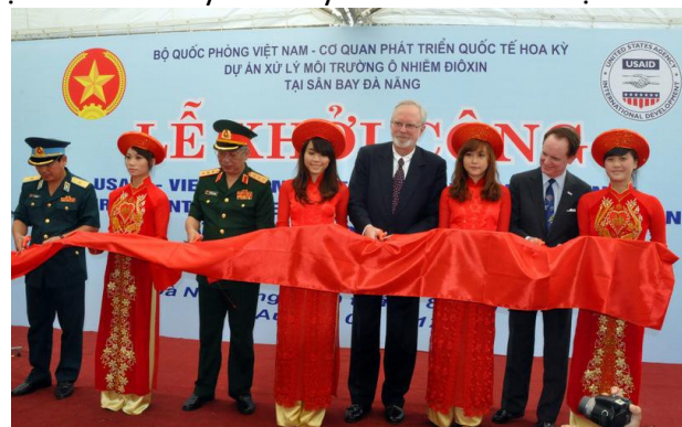
Lễ cắt băng khởi động Dự án Xử lý Môi trường Ô nhiễm Dioxin tại sân bay Đà Nẵng.

Hàng thập kỷ sau khi Hoa Kỳ kết thúc tham chiến tại Việt Nam, hàng trăm nghìn người Việt Nam tham gia cuộc chiến vẫn mất tích hoặc chưa xác định được danh tính. Chính phủ Việt Nam ước tính có 650.000 chiến sĩ mất tích trong chiến tranh. Chính phủ Hoa Kỳ đã cam kết các nguồn lực nhằm giúp đỡ Chính phủ Việt Nam tìm kiếm hoặc xác định nhân thân của các chiến sĩ bị mất tích này.