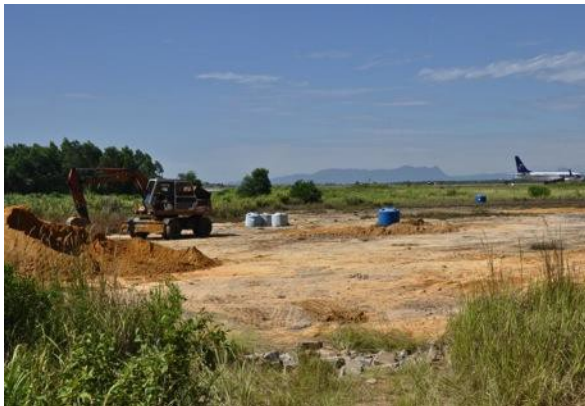
Các khu vực tại sân bay Đà Nẵng được xem là “điểm nóng” dioxin do mức độ tồn dư dioxin cao trong bùn đất.

Một trong những vấn đề nghiêm trọng nhất còn tồn tại sau cuộc chiến tranh tại Việt Nam là Chất Da cam. Các căn cứ không quân trước đây của Hoa Kỳ, bao gồm Đà Nẵng, Biên Hòa và Phù Cát được xem là những “điểm nóng” dioxin vì mức độ tồn dư dioxin cao còn sót lại hàng thập kỷ sau khi một lượng lớn Chất Da cam và các chất làm rụng lá được xử lý tại các khu vực này trong cuộc chiến tranh tại Việt Nam. Các mục tiêu chính sách đối ngoại cấp cao của Hoa Kỳ tại Việt Nam bao gồm giải quyết vấn đề Chất da cam, và vào năm 2008, chính phủ Hoa Kỳ và Chính phủ Việt Nam đã thống nhất tập trung ưu tiên hàng đầu của hai quốc gia về xử lý ô nhiễm vào khu vực tại Đà Nẵng.