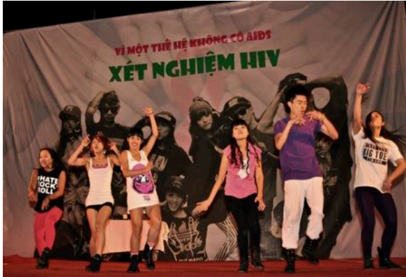
USAID và chương trình PEPFAR hỗ trợ một buổi hòa nhạc ngoài trời hưởng ứng tháng hành động quốc gia về phòng, chống HIV/AIDS của Việt Nam.

sát kết hợp hành vi và các chỉ số sinh học HIV/STI (IBBS) năm 2009 Vòng II và giám sát trọng điểm HIV ước tính đến 40% trong số 220.000 người tiêm chích ma túy (IDUs) ước tính (trong khoảng 100.000-335.000) bị nhiễm HIV. Người tiêm chích ma túy là nguyên nhân chính của tình trạng lây nhiễm ở Việt Nam. Trong cộng đồng nam quan hệ tình dục đồng giới (MSM) cũng nhận thấy tỷ lệ nhiễm HIV tăng lên, ước tính tỷ lệ này ở Hà Nội và thành phố Hồ Chí Minh đang ở mức cao là 16%.