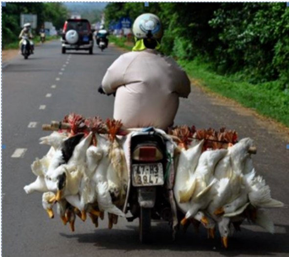
Việt Nam được xem là “điểm nóng” về dịch cúm gia cầm và sự xuất hiện của các bệnh dịch khác.

Việt Nam là một trong bốn quốc gia trên toàn thế giới bị ảnh hưởng bởi dịch cúm gia cầm độc lực cao (HPAI) với các đợt bùng phát dịch trên gia cầm xảy ra thường xuyên (trên 3.000 ổ dịch và đến nay hơn 40 triệu gia cầm đã bị tiêu hủy) và các ca bệnh nguy hiểm trên người (123 trường hợp, trong đó 61 trường hợp đã tử vong). Vi rút cúm gia cầm tiếp tục biến đổi và là mối đe dọa đến y tế công cộng, sức khỏe động vật và nền kinh tế.